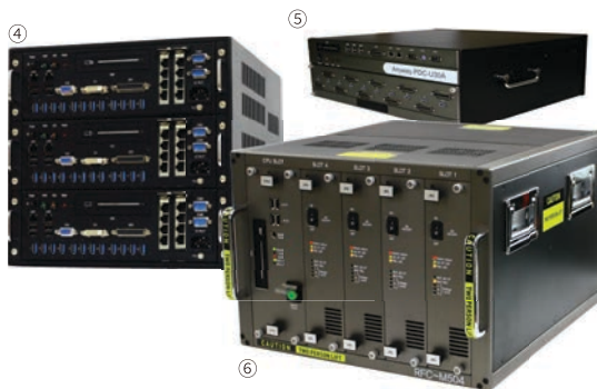
④ 비전 전용 트롤러 ⑤ 대용량 데이터 다운로드 전용 컨트롤러 ⑥ RF CAL 전용 컨트롤러

지난 30년간 산업용 컴퓨터와 이를 근간으로 산업용 자동제어기기를 개발, 스마트 팩토리 확산에 앞장서 4차 산업혁명시대에 필수적인 시스템을 비롯해 비전 검사장치, 로봇 컨트롤러 등을 출시하며 토털 솔루션 기업으로 도약하고 있는 기업이 있다.