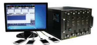
RFC-M504 스마트폰 무선 RF 측정에 최적화 된 컨트롤러