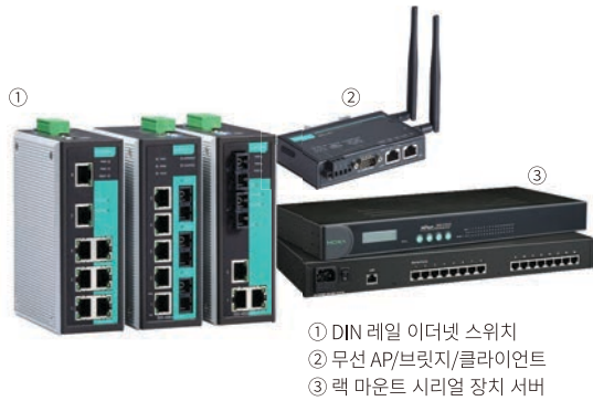
① DIN 레일 이더넷 스위치 ② 무선 AP/블루투스/클라우드 인터페이스 ③ 랙 마운트 시리얼 장치 서버