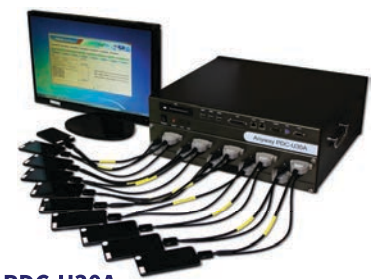
PDC-U30A 스마트폰 고속데이터 다운로드 전용 컨트롤러

또 성 대표는 “이노비즈 기업은 다른 기업들보다 건설하고 기술력도 있기 때문에 품질을 보장할 수 있다.”고 덧붙였다.