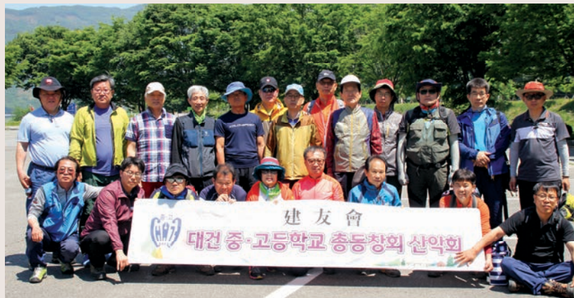
5월 27일 대구·재경 합동 산행