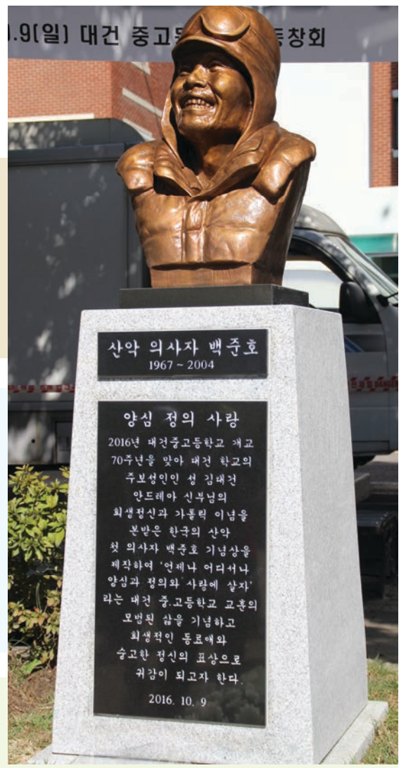
산악 첫 의사자 백준호 동문 흉상