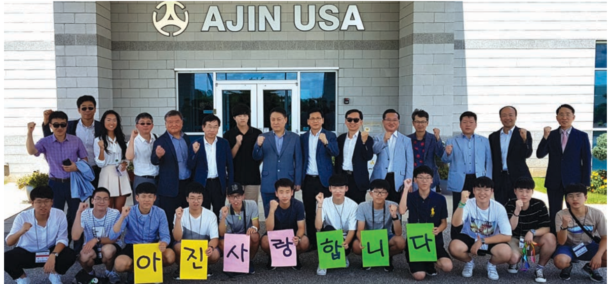
대전중고 미국문화탐방단은 지난 15일 미국 앨라배마주에 있는 자동차부품 제조회사 아진USA 공장을 견학했다.

이어 참전용사들은 한국전쟁과 대한민국 발전상을 소개하는 ‘대한민국 번영과 기적’ 동영상을 보며 잠시 눈시울을 붉히기도 했다. 대전중고 탐방단 학생들은 미리 연습한 미국 민요와 팝송을 불러 감사의 뜻을 전했고, 행사를 마친 뒤 일일이 참전용사의 손을 마주 잡고 감사와 존경의 뜻을 표했다.